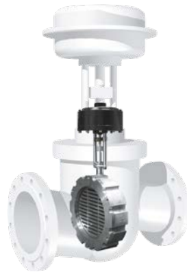
Größenvergleich zwischen einem normalen Sitzventil und einem Schubert & Salzer Gleitschieberventil. Beide haben dabei eine identische Nennweite.