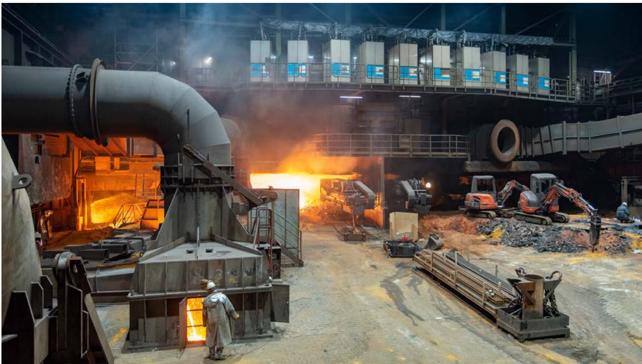
Schwelgern 1 compte parmi les hauts fourneaux les plus modernes au monde avec une capacité de production potentielle de 10 000 t par jour. 40 dispositifs SIP (gris-bleu sur la photo) ont été installés sur les tuyères au cours du projet, ils injectent de fortes pulsions discontinues d'oxygène industriel dans le lit de coke afin d'atteindre un effet en profondeur optimal.

Les premiers essais avec l'installation pilote SIP dans le haut fourneau Schwelgern 1 ont fourni des résultats si prometteurs que thyssenkrupp Steel Europe a décidé de poursuivre le développement du procédé au-delà du projet de recherche. Avec son diamètre au creuset de 13,6 m, une hauteur totale de 110 m