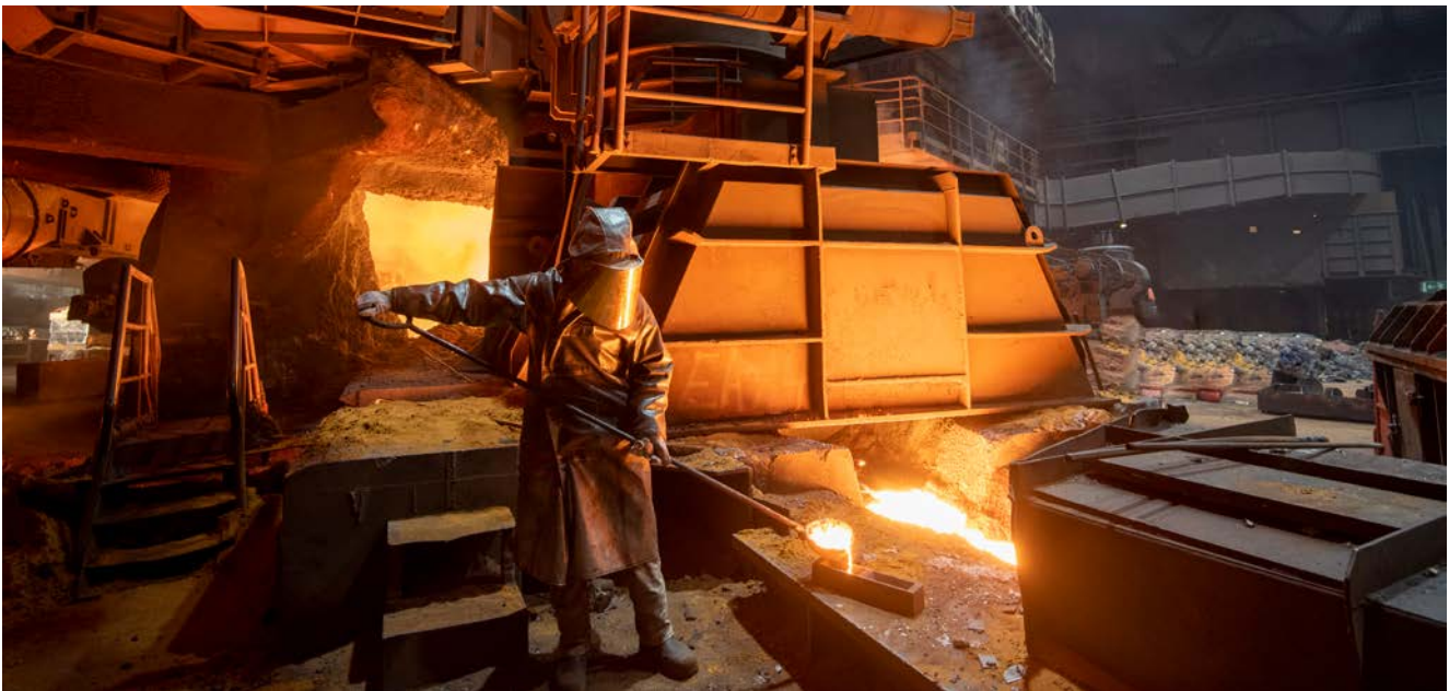
Le procédé SIP augmente considérablement l'efficacité de la production de fonte brute, avec des économies annuelles de plusieurs millions d'euros pour le haut fourneau Schwegelm 1 ; il a été amorti en moins de 2 années d'exploitation. Les économies de CO 2 annuelles s'élèvent à plus de 100 000 t.