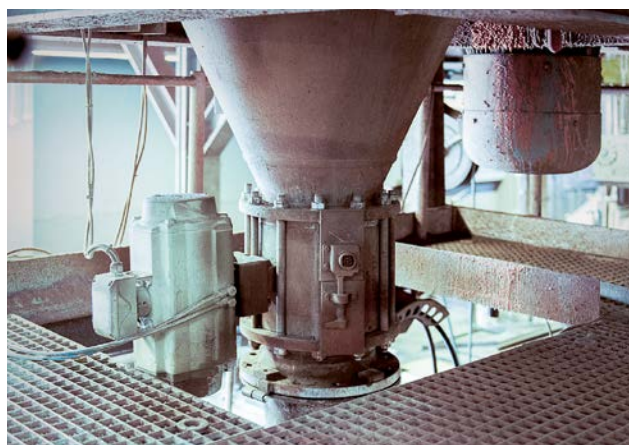
ill. 4 Vanne à secteur sphérique sur l'arbre mélangeur.

met de répondre aux exigences particulières de nos clients. Aussi nous équipons cette vanne à secteur sphérique d'actionneur special réglant le grammage dans les machines de papeterie avec une résolution ultraprécise de 8.192 pas de régulation avec 90° d'ouverture de vanne. De même, la vapeur jusqu'à 220 °C, les effluents ou les suspensions abrasives du minerai de fer, du charbon, du calcaire et les cendres volantes sont autant d'utilisations exigeantes de la vanne à secteur sphérique.