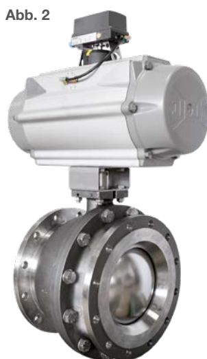
ill. 2 Les vannes à secteur sphérique de la série 4040 sont disponibles dans les diamètres nominaux DN 25 à DN 300. Jusqu'au diamètre nominal DN 250, les vannes sont prévues pour être montées entre brides (en DN 300 avec bride). Les niveaux de pression disponibles se situent entre PN 16 et PN 40 (de ANSI 150 à ANSI 300). Des valeurs K_{vs} entre 1,45 et 3.840 sont possibles selon le diamètre nominal. Ces vannes à secteur sphérique sont produites en inox, nuance 1.4408. Selon le matériau d'étanchéité choisi, les vannes à secteur sphérique peuvent être utilisées jusqu'à 220 °C.

Reiner Wolf, responsable conception chez Schubert & Salzer Control Systems GmbH complète : „La vanne à secteur sphérique est conçue pour une utilisation en présence de milieux particulièrement abrasifs mais le choix des matériaux d'étanchéité nous per-